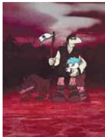
Gartxot -eko irudi bat.