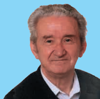
JOSÉ M a JIMENO JURÍO ( Artajona, 1927; Pamplona, 2002 )

Investigador del pasado en archivos y a través del trato con las gentes, es autor de numerosas publicaciones sobre historia, etnografía, arte y toponimia, entre ellas: Historia de Pamplona y de sus lenguas (1995), Navarra. Historia del euskera (1997), Al airico de la tierra (1998).