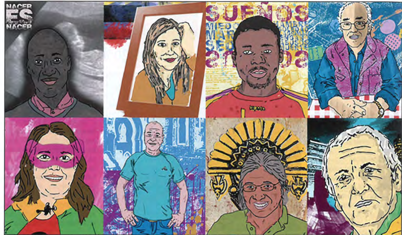
Ilustraciones, obra de Daniel Albers, de los ocho protagonistas de ‘De igual a igual’.

A veces me he sentido un poco intruso, entrando